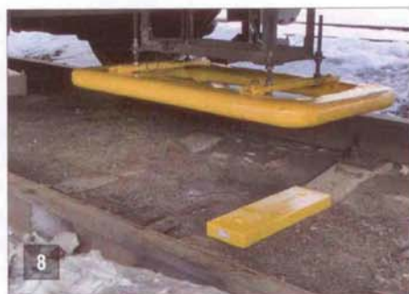
7. бортовой локомотивный компьютер 8. антенна ТКС-Л и путевой приемопередатчик