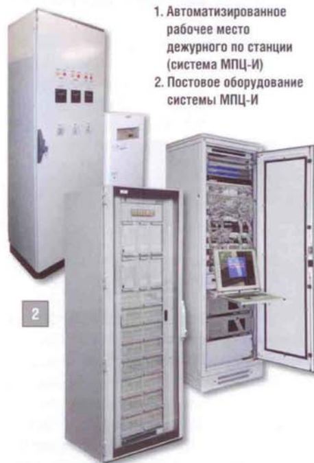
1. Автоматизированное рабочее место дежурного по станции (система МПЦ-И) 2. Постовое оборудование системы МПЦ-И