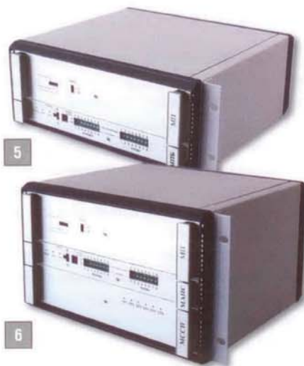
5. Полуккомплект МПБ 6. Переездной блок МАПС

Микропроцессорная полуавтоматическая блокировка МПБ , состоящая из двух одинаковых полуккомплектов, размещаемых на прилегающих к перегону станциях, реализует все функции релейной полуавтоматической блокировки, дополнительно обеспечивая контроль прибытия поезда на станцию в полном составе. Кроме того, передача информации между станциями при МПБ может осуществляться как по физической линии, так и по магистральному кабелю связи, волоконно-оптической линии связи или радиоканалу. При необходимости увеличения пропускной способности перегона МПБ дополняется автоматическим блокпостом АБП, выполненным на базе такого же полуккомплекта МПБ.