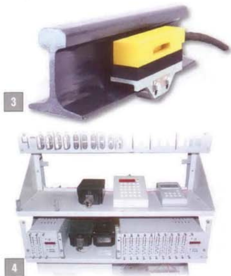
3. Рельсовый датчик (система ЭССО) 4. Постовое оборудование системы ЭССО

Хорошо зарекомендовавшая себя за годы эксплуатации микропроцессорная система контроля свободности участков железнодорожного пути методом счета осей ЭССО предназначена для контроля свободности участка пути любой сложности и конфигурации как на станциях, так и на перегонах. Эта система работает при любом, вплоть до нулевого, сопротивлении изоляции балласта, в том числе на участках с металлическими шпалами и стяжками, на цельнометаллических мостах. Она контролирует свободность перегонов, участков приближения к переездам, блок-участков при автоматической блокировке, стрелочных секций и приемоотправочных путей на станциях, стрелочных и бесстрелочных участков в системах горочных автоматических централизаций. Как и все системы НПЦ "Промэлектроника", ЭССО разработана с учетом отечественных условий эксплуатации (диапазон рабочих температур от -60 до +85^{\circ}\text{C} ) и обеспечивает увязку со всеми действующими системами железнодорожной автоматики.